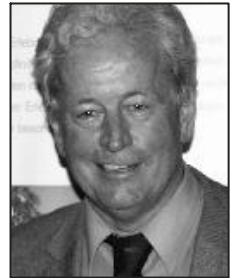
Dir. Christian Schindler

und herzlich Willkommen zu den 38. Montafoner Pferdesporttagen in Schruns-Tschagguns! Wie in den Jahren zuvor wird auch heuer wieder ein interessantes Programm mit tollen Pferden, hervorragenden Reitern und diversen Highlights geboten. Mit der im letzten Jahr neu gestalteten "Pferde Arena" im Bereich der ehemaligen Auhof-Reitanlage hoffen wir auch dieses Jahr wieder ein würdiges und den hohen Ansprüchen gerechtes Ambiente bieten zu können. Eine tolle Gastronomie und das Aktivpark Kinderprogramm runden das Angebot ab.